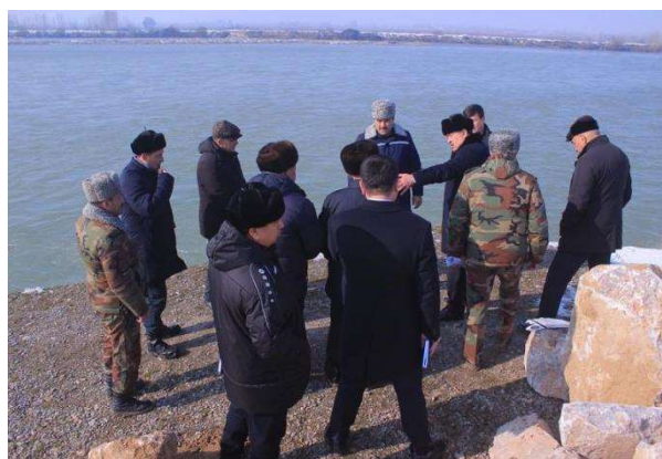
2-расм. Ишчи гуруҳ воқеа жойида