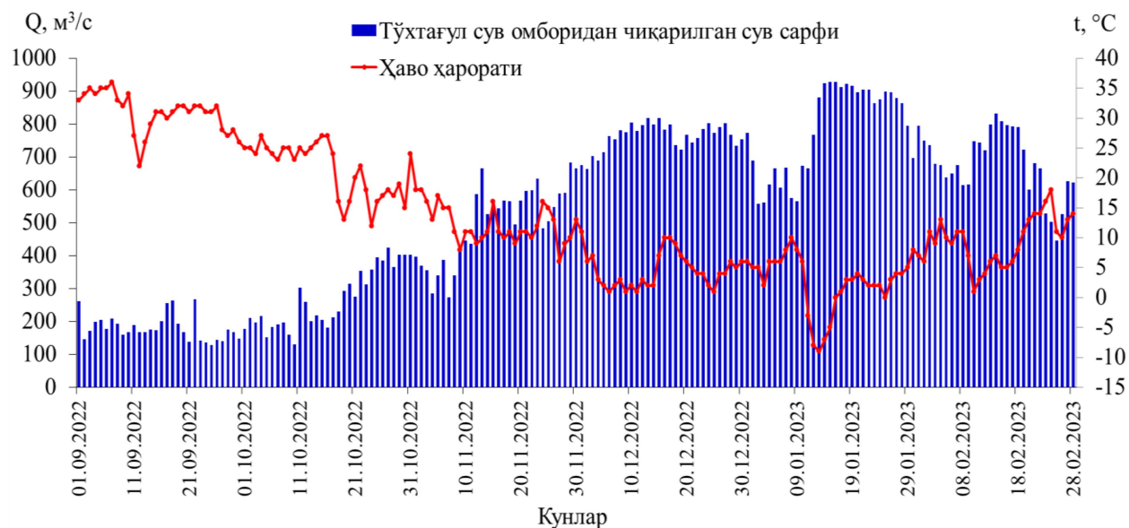
5-расм. Тўхтағул сув омбори тўғонидан қуйи бьефга ташланган сув сарфлари (Q) билан ҳаво ҳарорати (t) нинг ўзгаришлари (2022-2023 йй. куз-қиш мавсуми)

Ушбу график асосида ҳаво ҳарорати билан сув омбори тўғонидан қуйи бьефга чиқарилган сув миқдорларининг ўзгаришлари таҳлил қилинди. Жумладан, 2023 йилнинг 11 январидан 21 январигача ҳудудда ўртача кунлик ҳаво ҳарорати ( -10^{\circ}\text{C} гача) кескин пасайиб кетган, тунги соатларда эса ҳаво ҳарорати -20^{\circ}\text{C} дан ҳам паст бўлган. Шу туфайли электр энергиясига талаб ортиб, Тўхтағул ГЭС тўла қувватда ишлай бошлаган. Бу ҳолат сув омборидан қуйи бьефга чиқариладиган сув миқдорининг ортишига олиб келган.