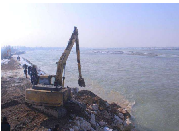
3-расм. Норин дарёси қирғоқларининг ўпирилиши натижасида юзага келган фавқулодда вазиятни бартараф этиш ишлари