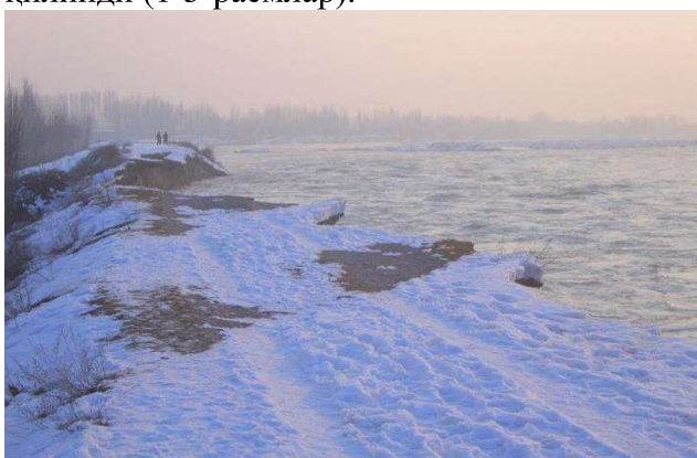
1-расм. Норин дарёсининг сув босган соҳиллари

Қисқача маълумотнома. Жорий 2023 йилнинг 26 январь куни оммавий ахборот воситалари ва ижтимоий тармоқларда Норин дарёсининг қуйи оқимида, яъни унинг Наманган вилоятининг Норин туманидан оқиб ўтувчи қисмида дарё қирғоқларининг ўпирилиши билан боғлиқ бўлган фавқулодда вазият юзага келганлиги тўғрисида хабарлар тарқалди. Ушбу фавқулодда вазиятнинг юзага келишига Тўхтағул сув омбори тўғонидан қуйи бьефга бир неча кун давомида катта микдорда сув ташланиши сабаб бўлган. Дарё қирғоқларини мустаҳкамлаш ишларига Ўзбекистон Республикаси Фавқулодда вазиятлар вазирлиги ва унинг Наманган вилояти бошқармаси, Ички ишлар вазирлиги ва унинг вилоят бошқармаси, Миллий гвардия, Наманган вилояти ҳокимлиги вакиллари ҳамда Фавқулодда вазиятлар давлат тизими (ФВДТ) мутахассислари ва ходимлари жалб қилинди (1-3-расмлар).