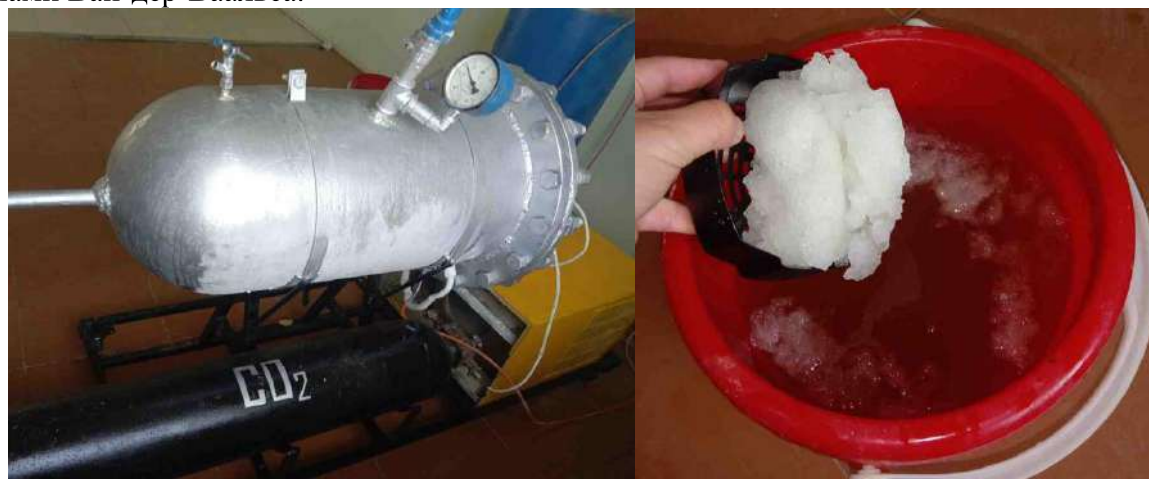
а) Экспериментально-модельная установка деминерализации вод; б) Образец полученного гидрата

Главной задачей экспериментально-модельной установки деминерализации (рис. 2а) было получение гидрата (рис. 2б). Конструирование и эксперименты проводились в ООО «Кашкадарё махсус темир бетон буюмлари». Процесс образования газовых гидратов осуществлялся за счет образования клатратов в процессе квантового перехода \text{CO}_2 в кристаллические структуры, содержащихся из молекул воды. Кристаллическая решетка газового гидрата (так называемый «хозяин») построена из молекул воды, удерживаемых водородными связями. Молекулы газа (гость), образующие гидрат, размещены во внутри полостях кристаллической решетки и удерживаются в них силами Ван-дер-Ваальса.