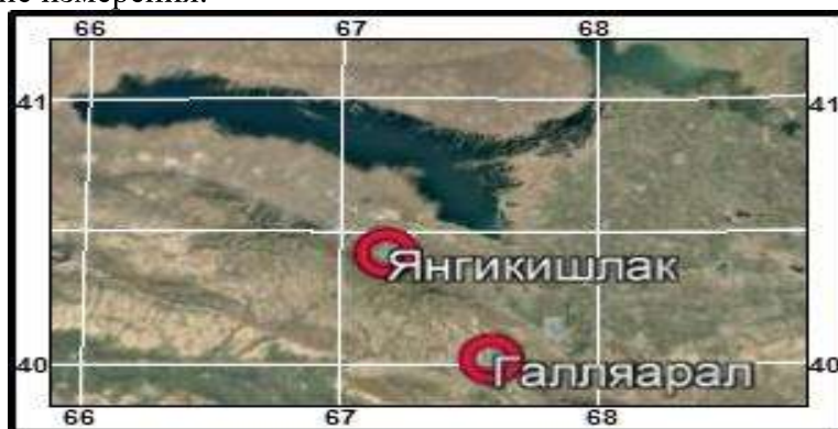
Рис. 1. Географическое положение метеостанций

Географическое местоположение, данные и методы расчёта. Географическое положение исследуемого района – Джизакская область Узбекистана, где расположены метеорологические станции Янгикишлак ( 40,42^\circ с. ш., 67,18^\circ в. д.) и Галляарал ( 40,02^\circ с. ш., 67,59^\circ в. д.) (рис. 1), на которых выполняются 8-ми срочные суточные метеорологические измерения.